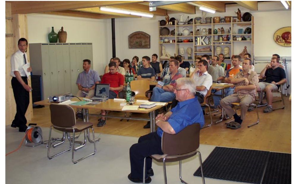
Beamerpräsentation im unfunktionierten Ökonomiegebäude.