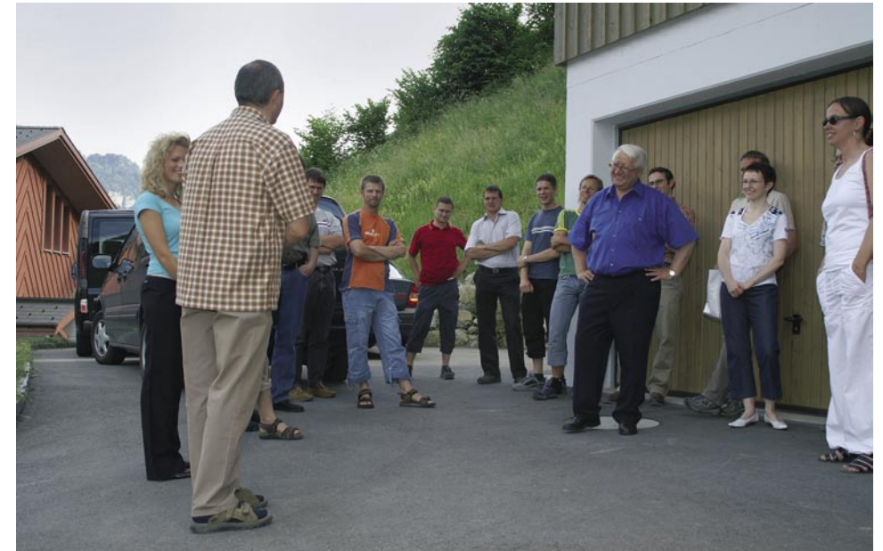
Ein lustiger Kreis von jung(geblieben)en Unternehmern.