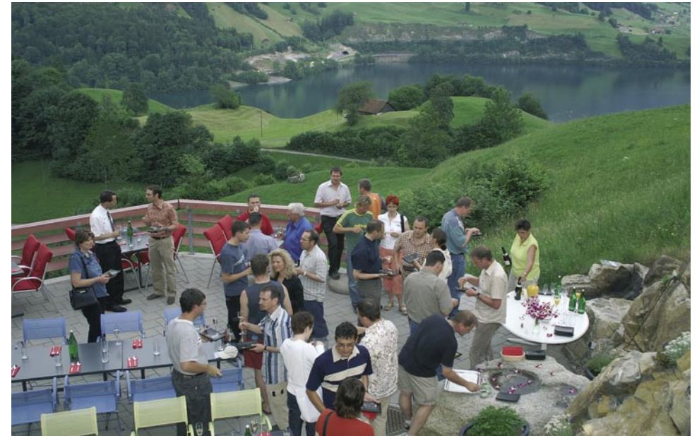
Thailändisches Apérobuffet vor traumhafter Obwaldner Kulisse.